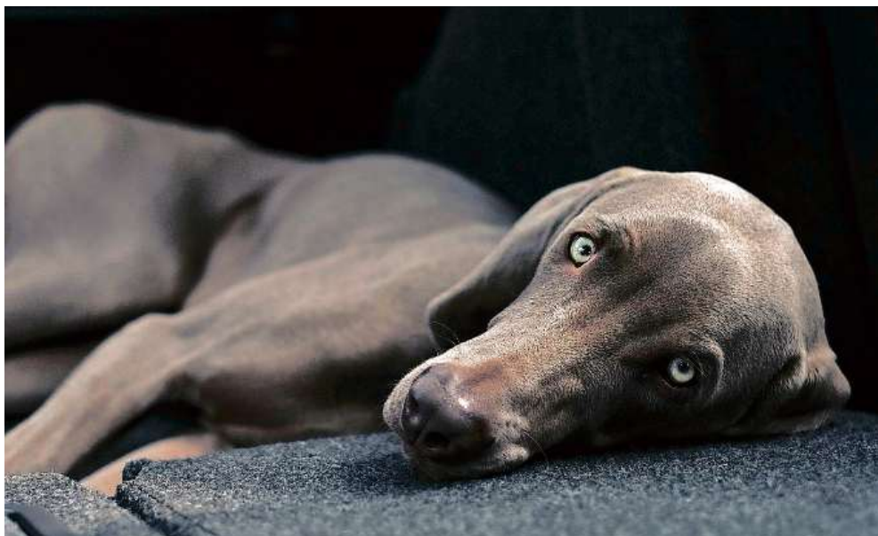
Nicht immer bleibt alles ruhig. Das Bellen von Hunden kann Nachbarn stören.

Weil das ortsübliche Mass je nach Kanton und Gemeinde unterschiedlich ist, können ähnliche Fälle je nach Gegend durchaus verschieden beurteilt werden. Häufig sind die Wohngebiete auch in sogenannte Empfindlichkeitszonen eingeteilt. In den Kantonen Aargau, Bern und St. Gallen beispielsweise gilt die Regel, dass in Wohnzonen die Haltung von drei erwachsenen Hunden pro Haushalt noch zonenkonform ist, was vom Bundesgericht bestätigt worden ist. Weil in Arosa keine entsprechenden kommunalen Vorschriften existieren, ist es denkbar, dass das Regionalgericht Plessur die bundesgerichtliche Argumentation übernimmt und ihren Nachbarn die Haltung der drei Hunden gestattet.»