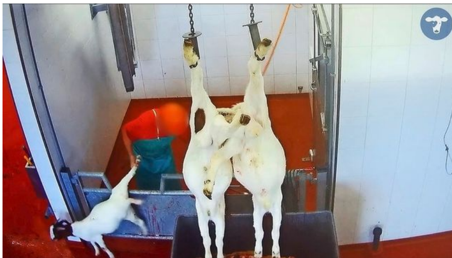
Panik im Schlachthof: Die Tiere werden direkt vor den Augen ihrer Artgenossen getötet.

Die Stiftung für das Tier im Recht geht gegen zwei Betriebe im Waadtland vor. Die Vorwürfe: Misshandlung, unsachgemässer Einsatz von Betäubungsgeräten und qualvolle Tötung.