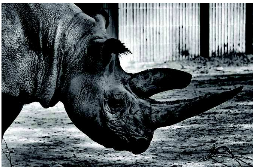
Für Schmuggler interessant: Das Horn des Nashorns.