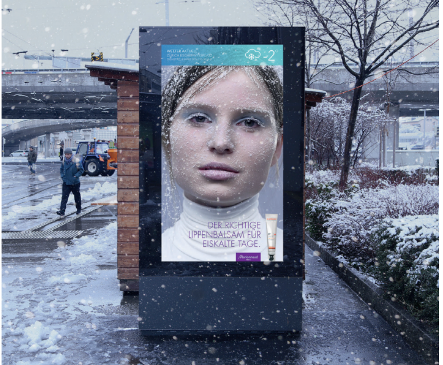
Marionnaud Schweiz (Y&R Group)