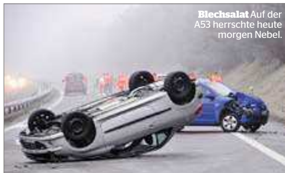
Blechsalat Auf der A53 herrschte heute morgen Nebel.

gang noch ab. Unfallbeteiligte und Zeugen können sich direkt bei der Kantonspolizei (044 938 30 10) melden. ●