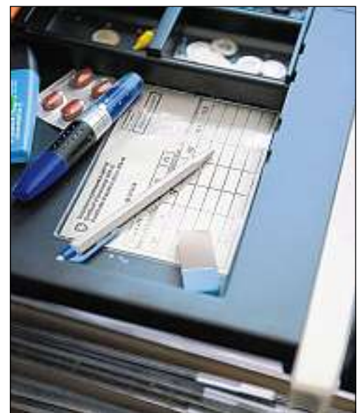
Restar activs era suenter la pensiuun è la finamira dal cussegl federal. KY

(pocha) Sin la A28 charravan dus autos ier in suenter l'auter. Cura ch'il prim ha vulì sviar a sanester ha il secund accelerà per passar. Per consequenza èn els collidads. Ils manischnunz èn vegnids blessads levamain, ils autos donnegiads totalmain.