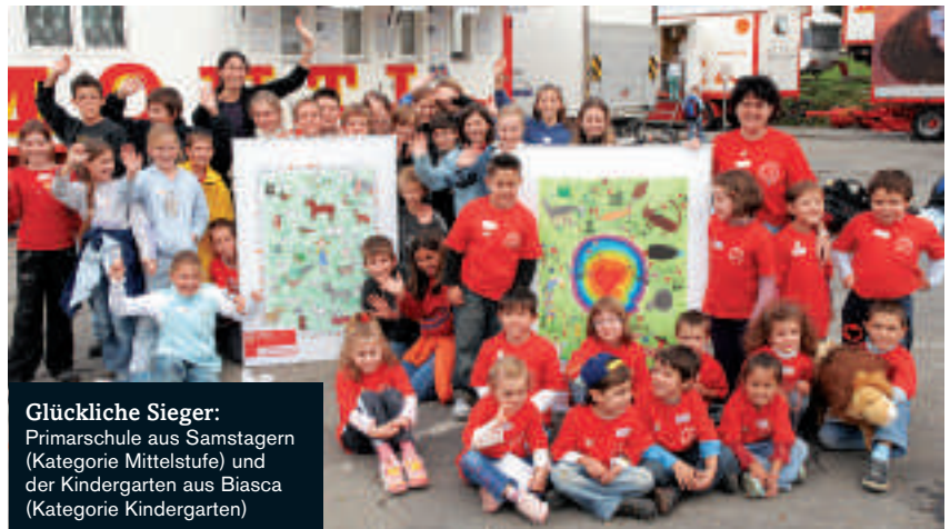
Glückliche Sieger: Primarschule aus Samtagern (Kategorie Mittelstufe) und der Kindergarten aus Biasca (Kategorie Kindergarten)