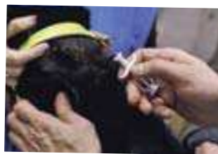
Chip im Ohr Seit 2006 Pflicht.

Liebe Frau Gamma Tatsächlich müssen alle Hunde, die nach dem 1. Januar 2006 geboren sind, mit einem Mikrochip markiert und in der zentralen Datenbank des ANIS registriert sein. Halter von Hunden, die schon vor diesem Datum tätowiert wur-