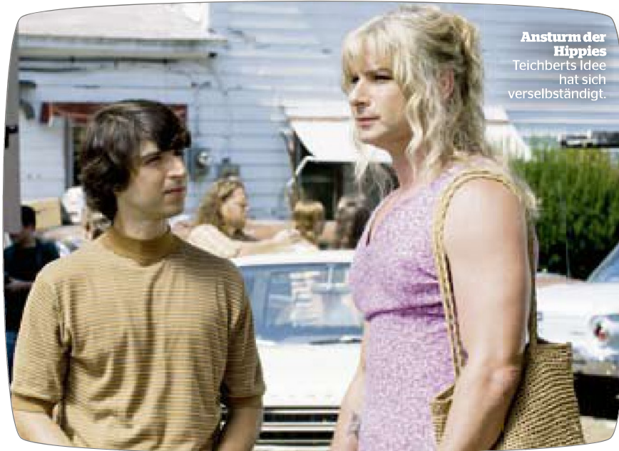
Ansturm der Hippies Teichberts Idee hat sich selbstständig.

Im Zentrum der Geschichte steht Teichbert (Demetri Martin), der eigentlich eine Karriere als Innenarchitekt in New York anstrebt. Weil das heruntergekommene Motel seiner Eltern in Bethel vor dem Aus steht, kehrt er aber regelmässig in sein Elternhaus zurück, um ihnen unter die Arme zu greifen und das marode Motel zu bewirtschaften. Als er im Juli 1969 erfährt, dass die Ver-