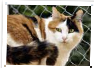
Büsi im Heim Frage der Haftung.

der Eigentümer des Tieres – hierfür geradestehen. Als Eigentümer muss man das Tierheim aber über allfällige risikohöhen Eigenschaften seines Tieres informieren. Tut man dies nicht, hat man für dadurch entstandene Schäden selber aufzukommen.